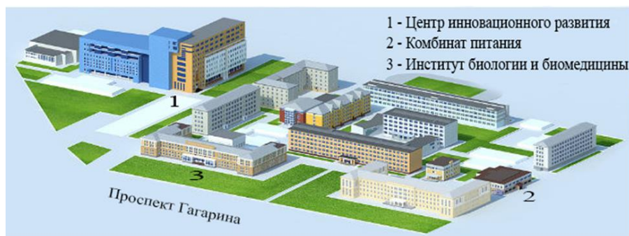
Схема университетского городка

АССОЦИАЦИЯ СПЕЦИАЛИСТОВ В ОБЛАСТИ МОЛЕКУЛЯРНОЙ, КЛЕТОЧНОЙ И СИНТЕТИЧЕСКОЙ БИОЛОГИИ